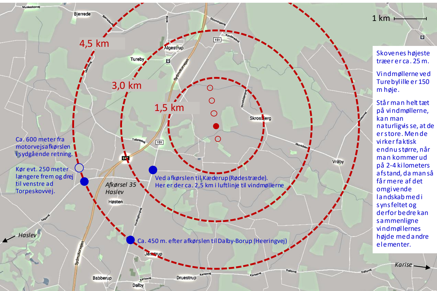
Kort over området ved Turebylille . Afstanden er beregnet fra den fjerde af de 5 vindmøller.